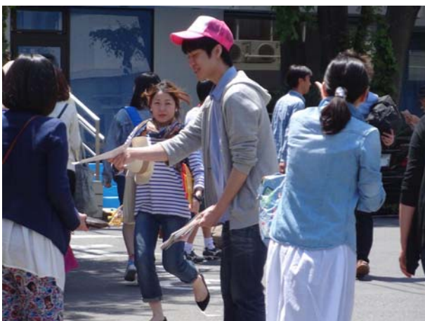
パンフレット配布